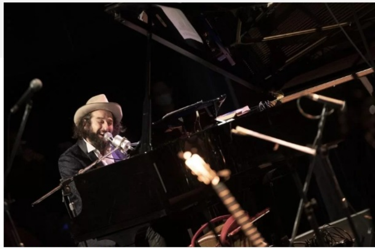
Vinicio Capossela